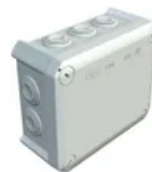
Kabelabzweigkasten T100 Bettermann lichtgrau, halogenfrei IP55-IP66