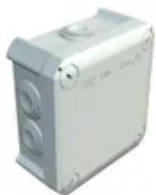
Kabelabzweigkasten T60 Bettermann lichtgrau, halogenfrei IP55-IP66